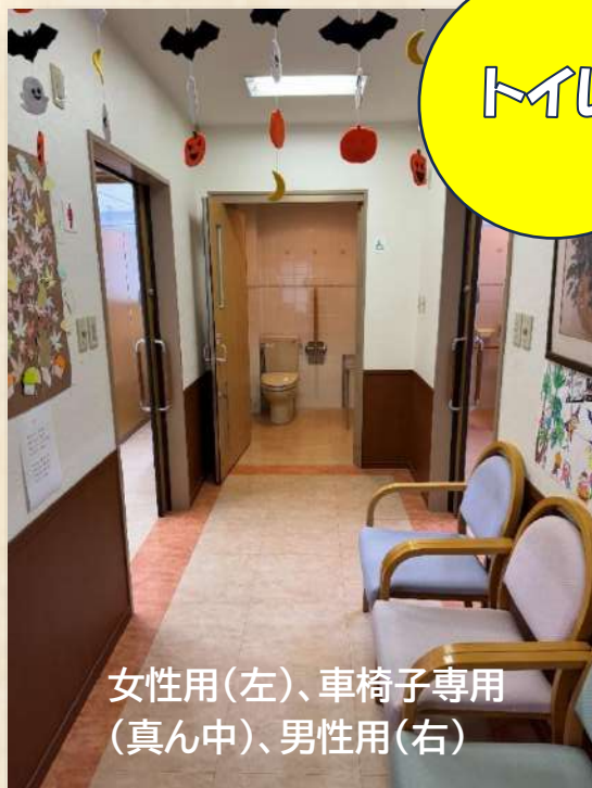
女性用(左)、車椅子専用(真ん中)、男性用(右)