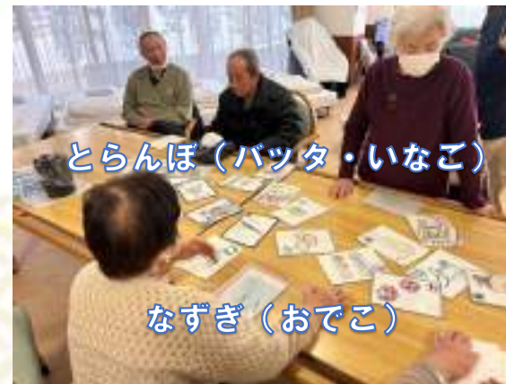
とらんぼ (バッタ・いなこ)